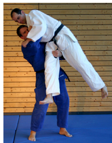
Konten gegen Schenkelwurf oder Hüftfeger

Eine weitere sinnvolle Übung ist, die Technik zu werfen und dabei in 5er- und anschließend in 3er-Schritten von 150 auf 100 rückwärts zu zählen. Sobald Du bei 100 bist wird gewechselt.