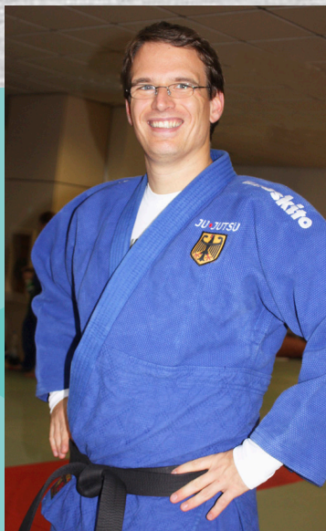
Titelfoto EUROPAMEISTERSCHAFT 2009 Carlo Clemens vs Frederique Husson